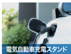
電気自動車充電スタンド