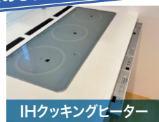
IHクッキングヒーター