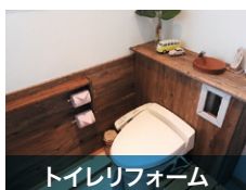
トイレリフォーム