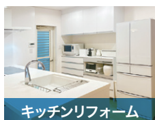
キッチンリフォーム