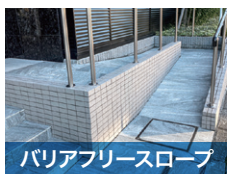
バリアフリースロープ